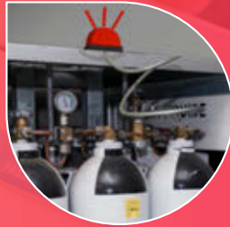
Un'eventuale situazione di allarme è visualizzata dal semaforo rosso.